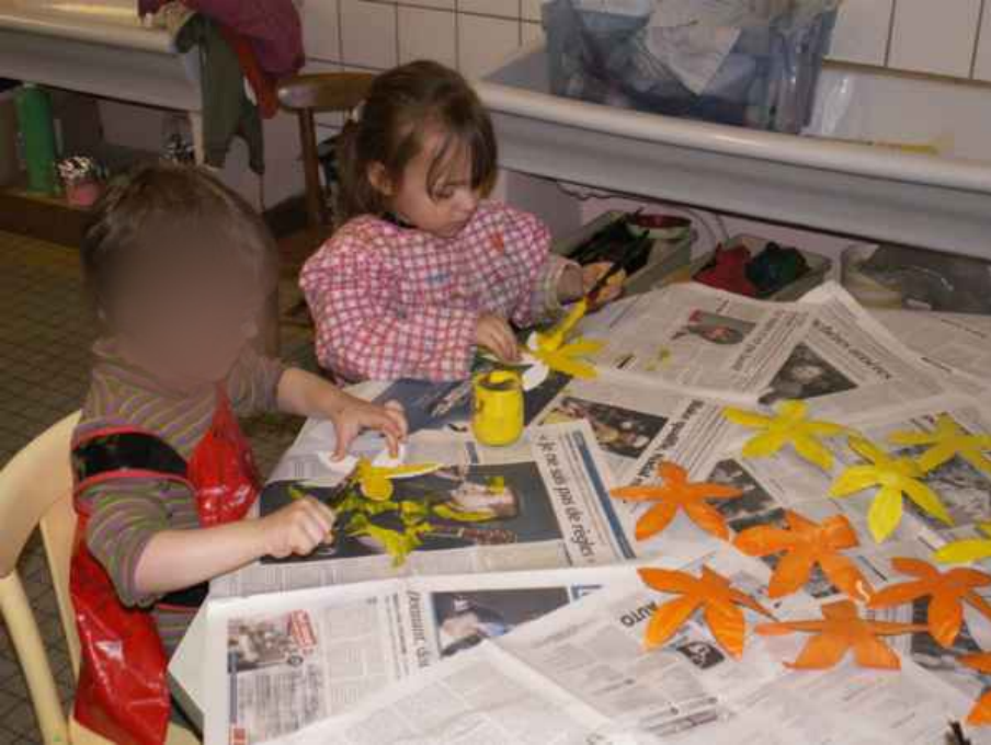
TPS et PS : Imaginer/sentir/créer