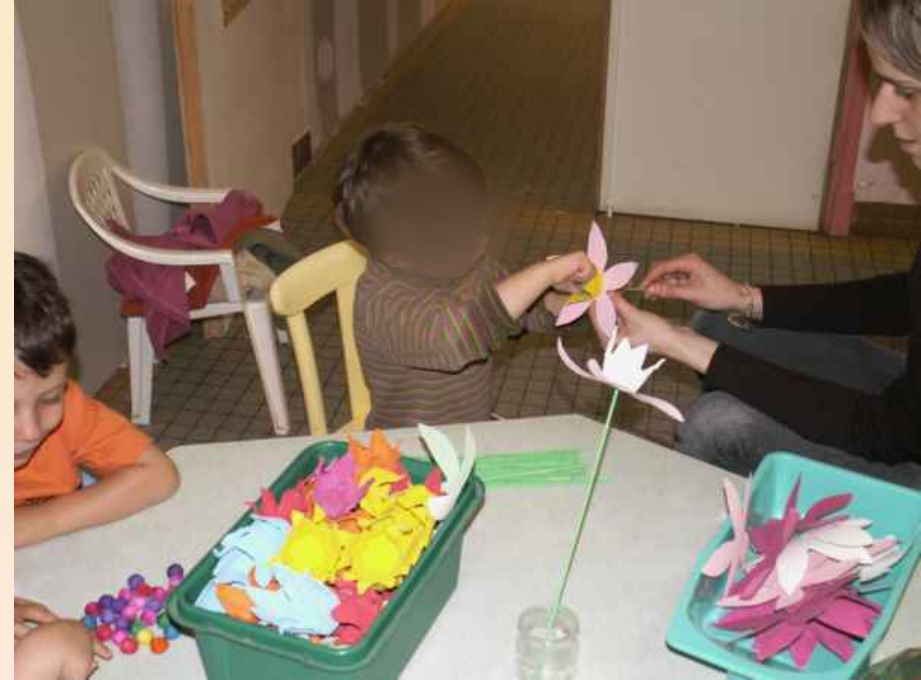
Création de fleurs pour la kermesse de l'école